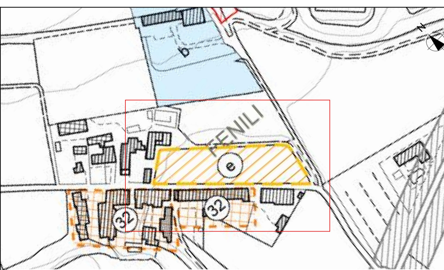
Estratto del Piano degli Interventi Scala 1:2000

Art. 40 - Zona "C2" Residenziale di espansione Let. "e" - obbligo di strumento attuativo