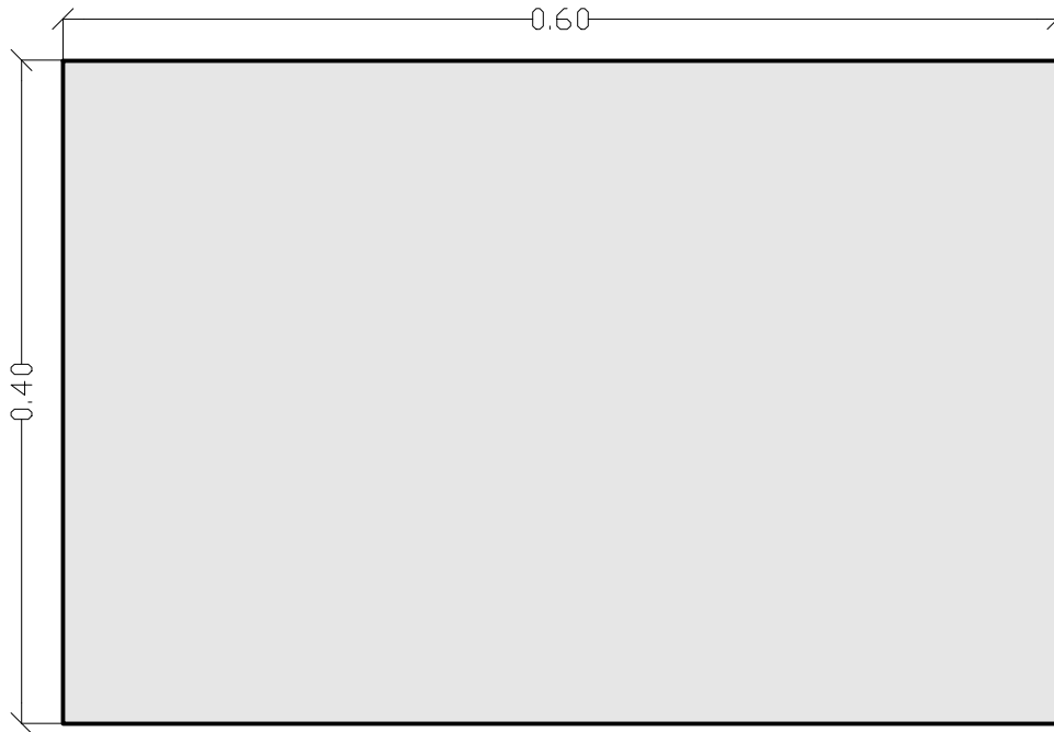
FORMATO 1 - 60 x 40 cm